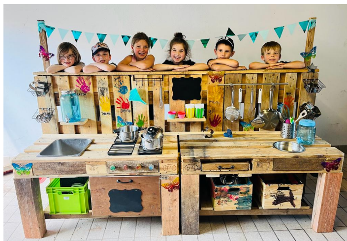
Text: Sabine Loscheider und Jennifer Maximini

Die Vorschulkinder und ihre Familien bedanken sich für eine bunte Kindergartenzeit und hoffen, dass die Unikat - Matschküche viel Freude bereitet!