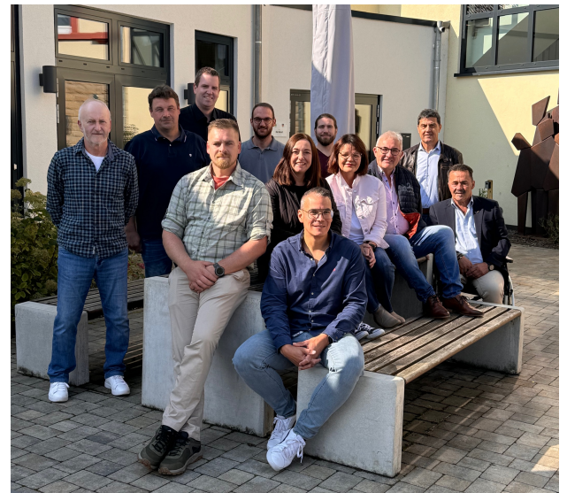
Auf dem Foto fehlt: Rüdiger Hauer

*Hinweis: In den Ausschüssen können auch Personen vertreten sein, die nicht dem Gemeinderat angehören.