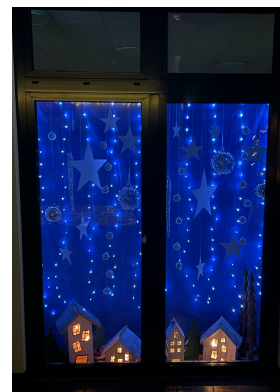
Text: Margot Ixfeld